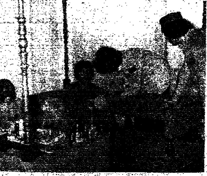
عملية انسحاب أحد المسلحين